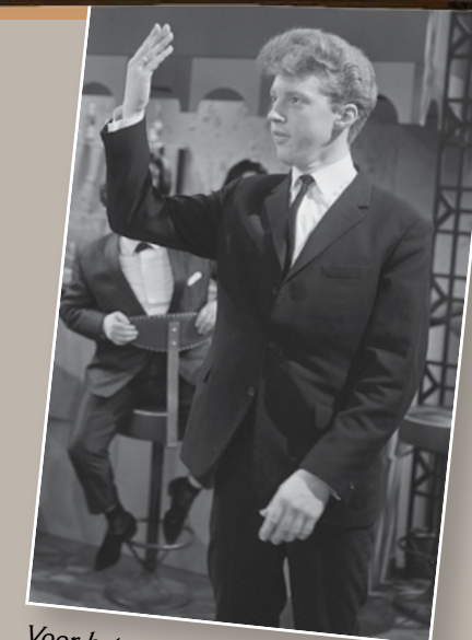
Voor het optreden in de show van Willy & Willeke kreeg ik ook lovende kritieken